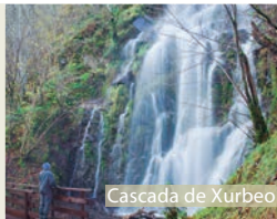
Cascada de Xurbeo